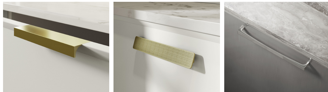
maniglia incasso a filo anta WZ4 recessed handle flush to the door WZ4 poignée encastrée au plat de la porte WZ4 tirador empotrada a ras de la puerta WZ4